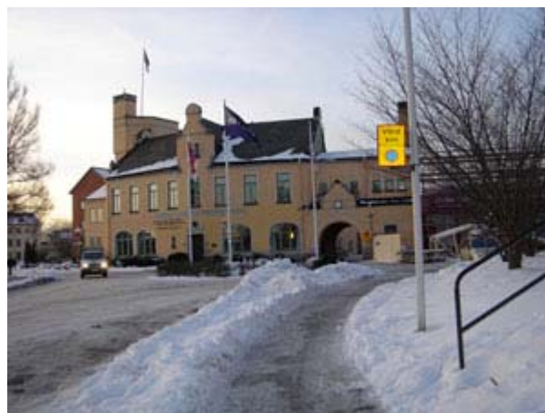
Munktells Mekaniska Verkstad 2007. Idag inryms hotell och museum i byggnaden. Tillbyggnad sker till höger om porten. Fler hotellrum behövs! Fotot är taget den 1 februari 2007.

Eskilstuna (Brunnsta) utan världen över!