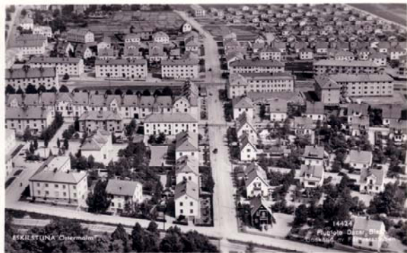
Flygfoto över Östermalm i Eskilstuna.

Bildvisning och kaffe med dopp i vanlig ordning fick avsluta mötet.