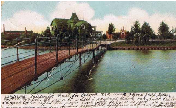
Strömsholmen från Hamngatan. Vykortet är postgånget 1905.