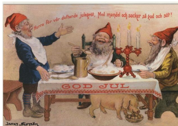
Jenny Nyströms julkort är postgånget 1907.

Medlemmarna önskade varandra God Jul och Gott Nytt Samlarår.