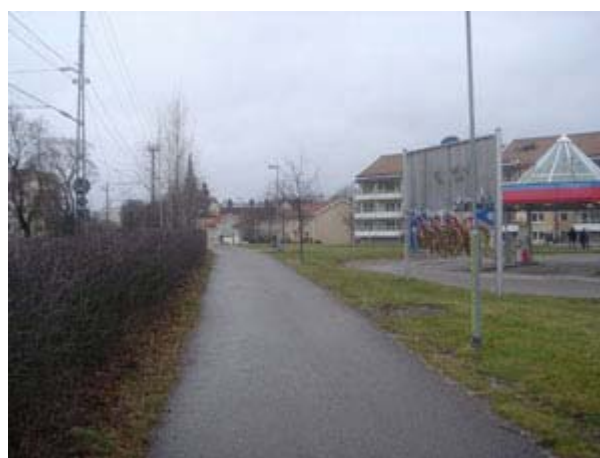
Södra Järnvägsstationen, Eskilstuna - Foto taget den 2 december 2006

År 1931 förstatligades järnvägen och eldrift infördes 1936. Vid denna tid fick Södra stationen ny byggnad som revs 1976.