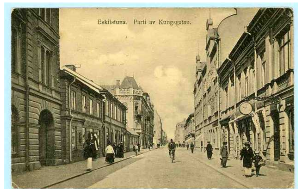
Parti av Kungsgatan. Vykortet är postgånget 1918.

Lördagen den 25 september var det dags för föreningens månadsmöte. Efter att ordföranden uppdaterat de närvarande medlemmarna om vad som hänt sedan senast var det dags att titta på bilder från förr.