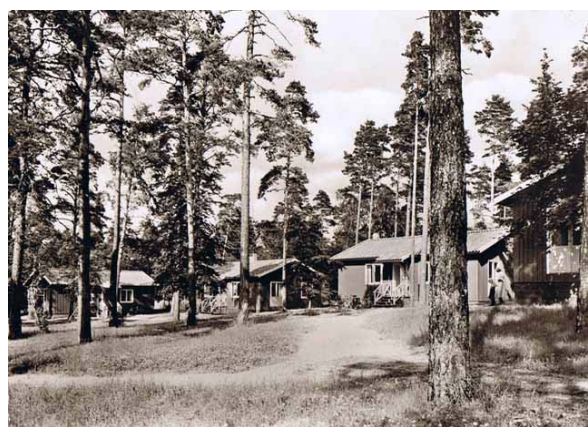
Sundbyholm - semesterstugorna. Vykortet postgånget 1966