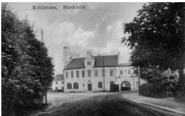
Munktells Mekaniska Verkstad - Vykort postgånget 1915.

AB Bolinder-Munktell har sitt ursprung i de mekaniska verkstäderna Munktells Mekaniska Verkstad som etablerades i oktober 1832 i Eskilstuna och J. & C.G. Bolinders Mekaniska Verkstad , etablerat 1845 i Stockholm.