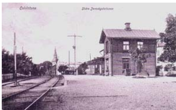
Södra Järnvägsstationen, Eskilstuna - Vykort postgånget 1910.

Hösten 1895 invigde kung Oskar II Norra Sörmlands Järnväg. Därmed fick Eskilstuna direkt järnvägsförbindelse med Stockholm.