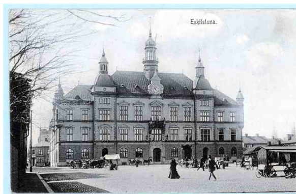
Stadshuset och Rinmans torg. Vykortet är postgången 1921.

Men deltagarna fick också se var Nystedts Elektriska startade sin verksamhet, likväl som Söderbergs Metallgjuteri. Erikssons Bageri, sedermera Skogaholms Bageri, startade också sin verksamhet i området.