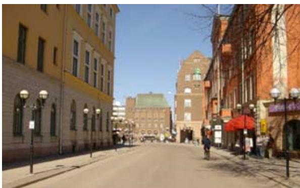
Foto taget april 2006. Förändringen är inte så stor. Det som kan noteras är att husfasaderna på både det Öbergiska huset och Stadshuset har moderniserats - på gott och ont.

Till vänster om Sparbankshuset syns Telegrafhuset. Byggnaden, som också uppfördes 1914-16, inrymde både post och telegraf.