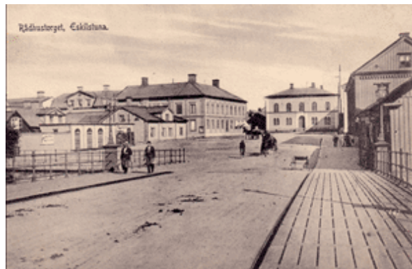
Rådhusbron – vykortet är postgången 1906.

År 1851 stod det nya Rådhuset färdigt, sedan det gamla blivit bostadshus vid Rademachergatan.