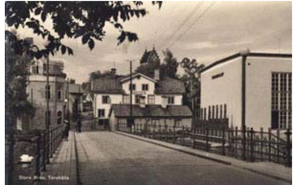
Vykort – Torshällas Stora Bron. Vykortet är postgånget 1942.

Här syns Lill-Jans krog, träbyggnad från första delen av 1700-talet (t h om bron).