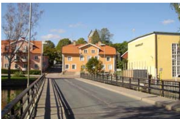
Stora Bron i Torshälla – året är 2006.

Krogen nedmonterades 1955 för att sparas, men låg tyvärr och ruttnade bort.