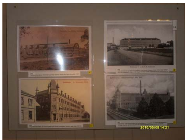
Utställningsskärm som visar en del industrihistoria.

På söndagen den 9 maj genomfördes en tipspromenad med 10 frågor om Eskilstuna inne på området där Eskilstuna Museer bistod med fina priser.