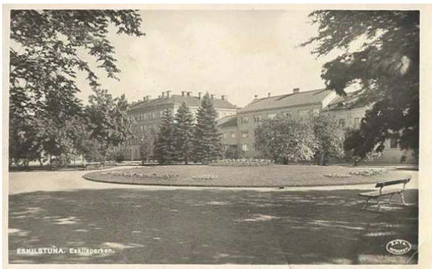
Eskilsparken – vykort från 1930-talet.

På grund av olika anledningar blev den planerade våravslutningen med guidad stadsvandring i Tunafors flyttad på framtiden.