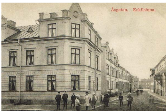
Åsgatan i Nyfors i början av 1900-talet. Vykortet är postgånget 1909.

En vacker bukett vårtulpaner överlämnades, som ett varmt tack för ett mycket intressant föredrag, till Lena.