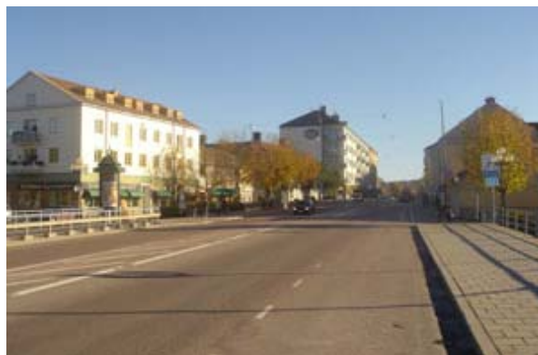
Rådhusbron 2006.