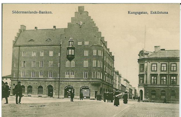
Vy från Fristadstorget. Tidigt 1900-tal.

Skärmarna har storleken 700 x 500 cm, med 4 förstorade vykort på varje skärm. Detta för att lätt kunna sammanställa en utställning med beställarens önskemål.