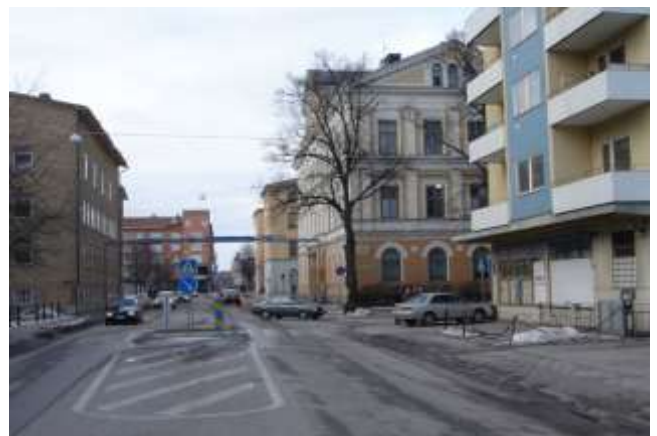
Korsningen Nygatan Careliigatan. Trafiken har ökat dramatiskt. Bredden på gatan likaså. Fotot är taget den 4 mars 2007.

I förgrunden syns byggnader både till höger och vänster. Vet inte vad dessa inrymde, men kanske någon annan vet? En sak är i alla fall säker - inget av dem finns kvar idag.