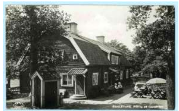
Pilkrog. Vykortet är postgånget 1940-tal.

För den som vill fynda mer tipsar vi om Lindens loppis som äger rum lördagen den 30 april, kl 10-15. Lördagen den 7 maj är det dags för ännu en loppis i Lindens regi, denna gång i en något mindre omfattning.