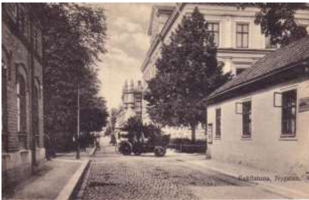
Korsningen Nygatan/Careliigatan 1904.

Vy över korsningen Nygatan-Careliigatan i centrala delarna av Eskilstuna.