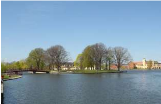
Strömsholmen 2007

Sliphuset och restaurangen är borta. Bolinder Munktell finns dock kvar. Där bedrivs visserligen annan verksamhet idag än tidigare. I området finns ett av det mest spännande och expansiva "nätverkshusen" (Munktell Science Park) i Eskilstuna. Under sommartid blomstrar ändå verksamheten på Strömsholmen. Här hålls konserter, festivaler och uppträdanden av klass. Tivoli med lottstånd i långa rader, öltält och annat som har med nöje att göra. En del Eskilstunabor tar tillfället i akt, när solen värmer gott, att ligga och sola, äta picknickkorgens innehåll m m där ute. Visst vore det väl trevligt att få en