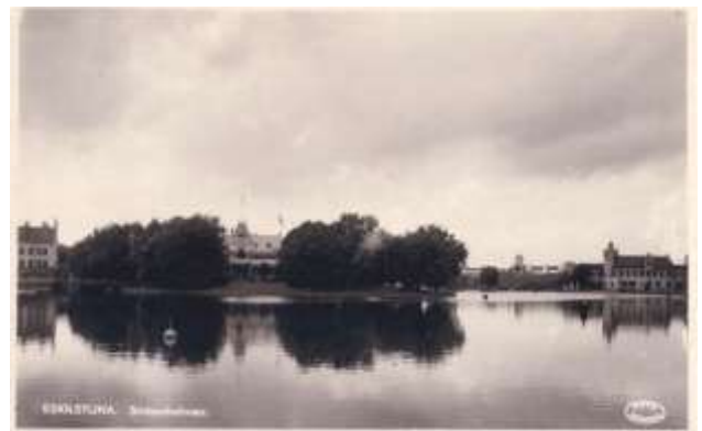
Strömsholmen med dess restaurang någon gång på 1930-talet.

ett av de första "nätverkshusen" som fanns i Eskilstuna? Det hyrdes nämligen ut lokaler till småföretagare som här kunde få tillgång till elektricitet till sin verksamhet. Byggnaden revs 1954.