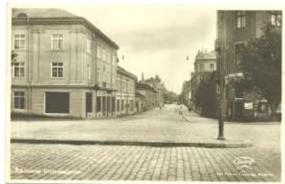
Drottninggatan och Järnvägsplan. Vykortet är postgången 19210