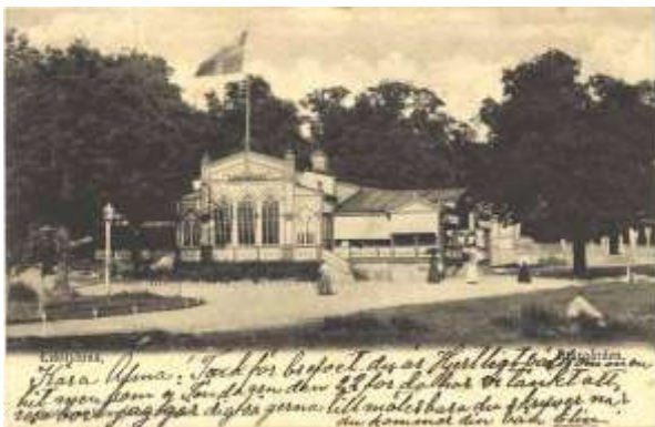
Djurgården. Vykortet är postgånget i början av 1900-talet.