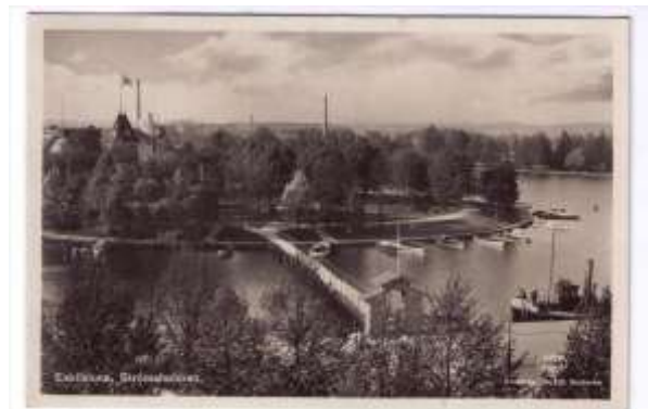
Strömsholmen. Vykortet postgånget 1910.

Även här var det många som kände igen sig och kunde konstatera att det är synd på alla rivningar av kvarter som ägt rum i centrala Eskilstuna. En del kanske varit nödvändiga, medan andra ägt rum av andra skäl.