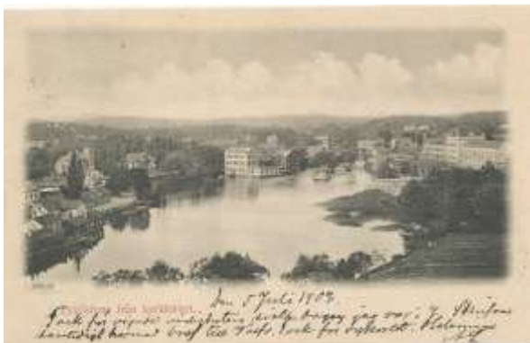
Vy från kyrktornet. Vykortet är postgånget 1902.

Nästa Mälardalsträff äger rum i höst och kommer även den hållas i Västerås.