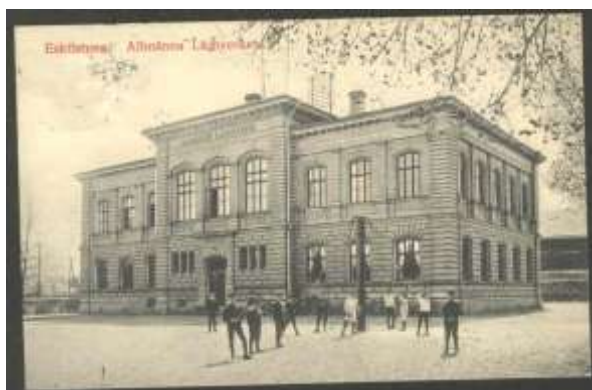
Allmänna läroverket, vykortet postgånget 1910.