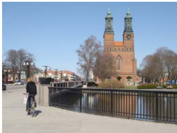
Nybron och Klosters Kyrka år 2006.

Båttrafiken fanns kvar på ån fram till att man startade byggnationen av den nya bron - 1966. I slutet av 1967 påbörjade man riva denna.