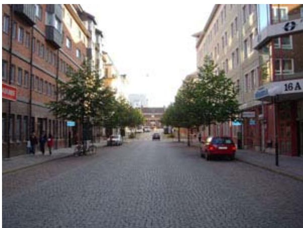
Drottninggatan med Centralstationen i slutet (eller början) av gatan 2006.

Gammal bebyggelse på båda sidor av gatan. Lagg märke till den stenbelagda vägbeläggningen. Den asfalterades så småningom.