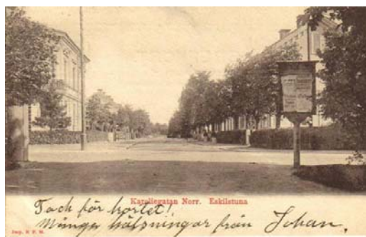
Carelligatan tidigt 1900-tal.