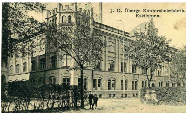
Öbergs Kontorsfabrik låg på Gymnastikgatan. Kortet är postgånget 1916.