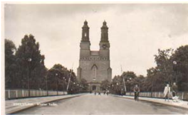
Vykort - Nybron och Klosters Kyrka – postgånget 1944.

Här ser vi den gamla bron som gick rakt mot kyrkan. 1928 startade en andra ombyggnation av den gamla träbron som hade funnits på samma ställe sedan 1866. 1931 stod den öppningsbara klaffbron klar.