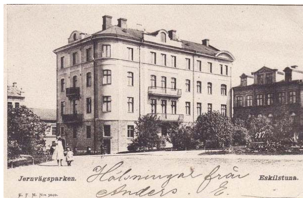
Jernvägsparken tidigt 1900-tal.

mail från Finlands största vykortsförening, Apollo, kom.