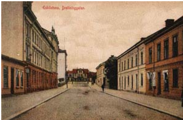
Drottninggatan med Centralstationen i slutet (eller början) av gatan tidigt 1900-tal.

Här ser vi Drottninggatan upp mot Centralstationen, vykortet är postgånget 1910.