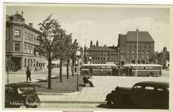
Fristadstorget på 30-talet.

Efter årsmötet passade de närvarande på att betala medlemsavgiften och fick 2009 års medlemskort i handen. Detta har i år har den fina 350-årsjubileumslogon! Inbetalningskort kommer att sändas ut efter Vykortsmässan till dem som då inte betalt.