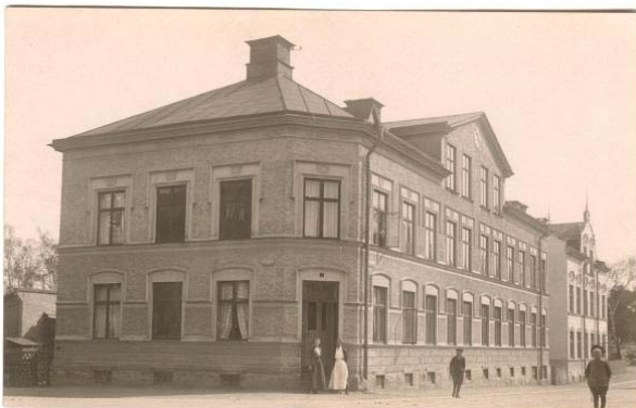
Bergsgatan i Nyfors. Vykortet är postgången 1915.

Ny rubrik i menyraden är Vykortsmässa 2009 . Där kommer all information att läggas ut som man kan behöva veta om Vykortsmässan. Vi har därmed tagit bort informationen om mässan på Aktivitetssidan.