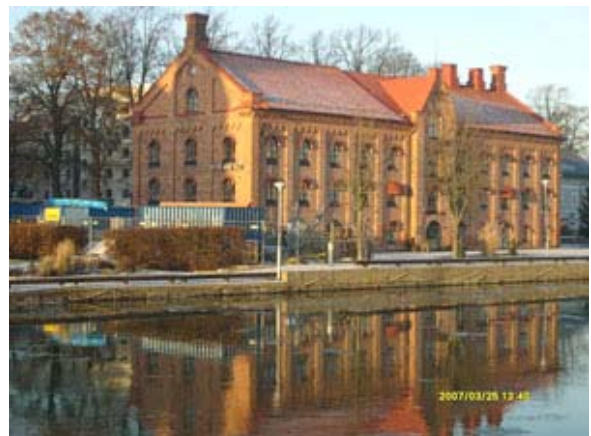
Kyrkans Hus i december 2008

Lenart Pettersson tog nedanstående foto i december månad 2008.