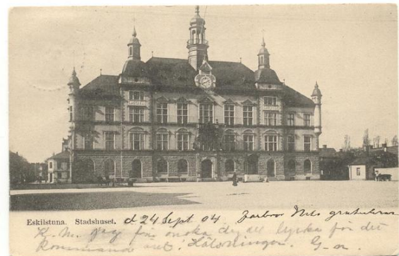
Stadshuset i Eskilstuna. Vykortet är postgången 1904.