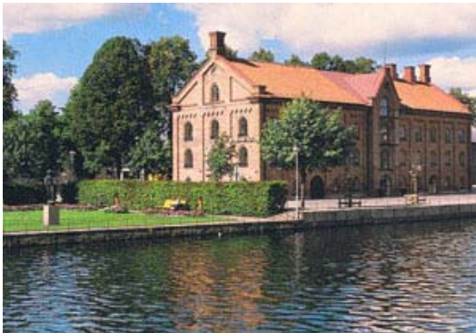
Celsingka Magasinet, Haakonbolaget, Kyrkans hus, ägarna har varit många till huset. Vykortet är postgånget 1985