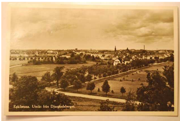
Utsikt från Djurgårdsberget. Vykort postgånget 1923

Jag har fått veta att rälsen var speciellt utlagd för transporter till och från Luth & Roséns fabrik.