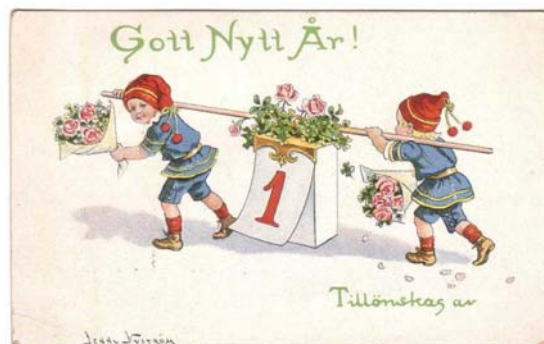
Nyårskort tecknat av Jenny Nyström i början av 1900-talet.

Föreningen finns representerad på nätet – www.etunavykort.se – där information om föreningens verksamhet uppdateras regelbundet.